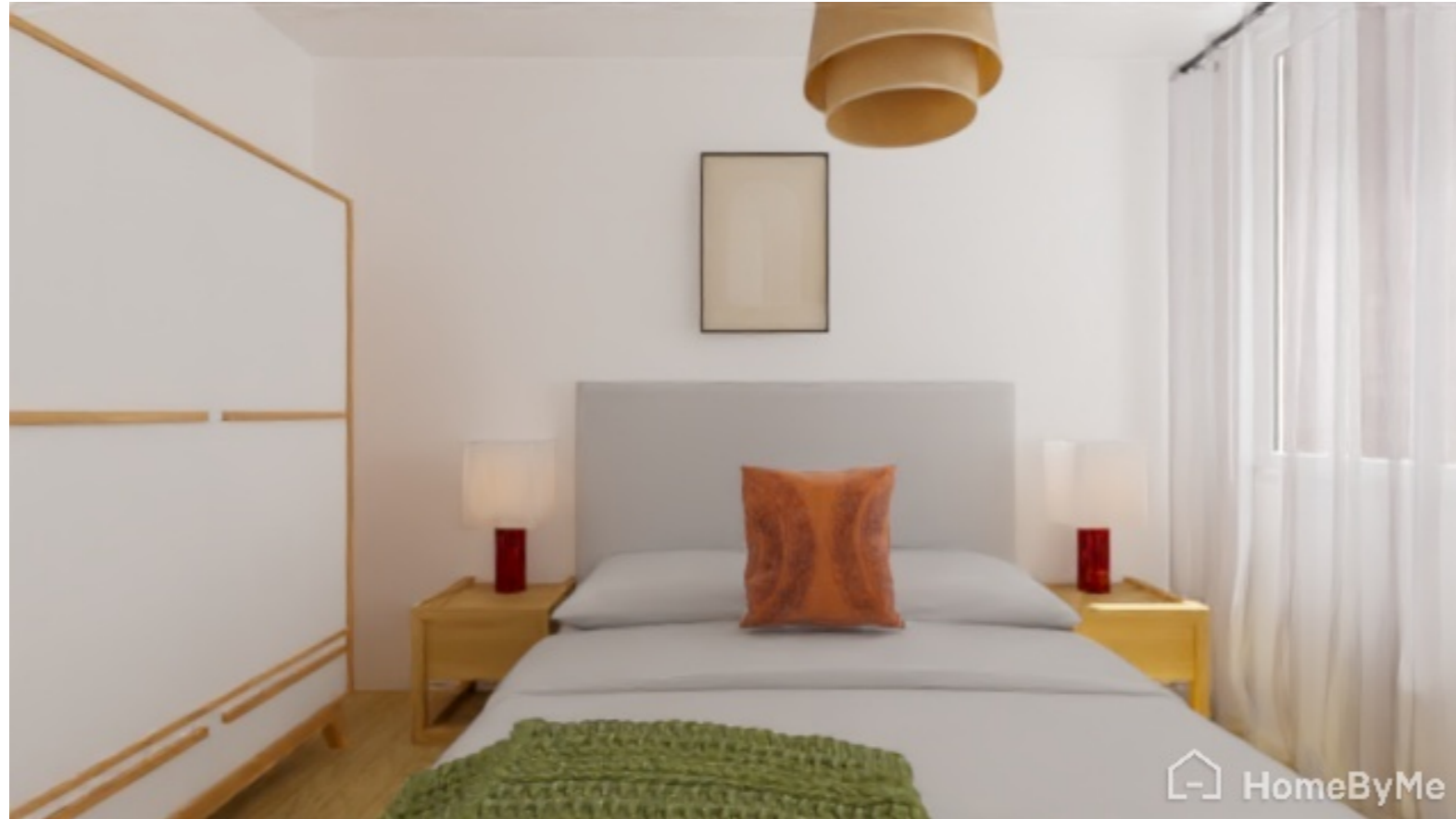
Une chambre suffisamment décorée pour donner envie

Objectif : réchauffer la pièce avec quelques touches de couleurs et objets décoratifs