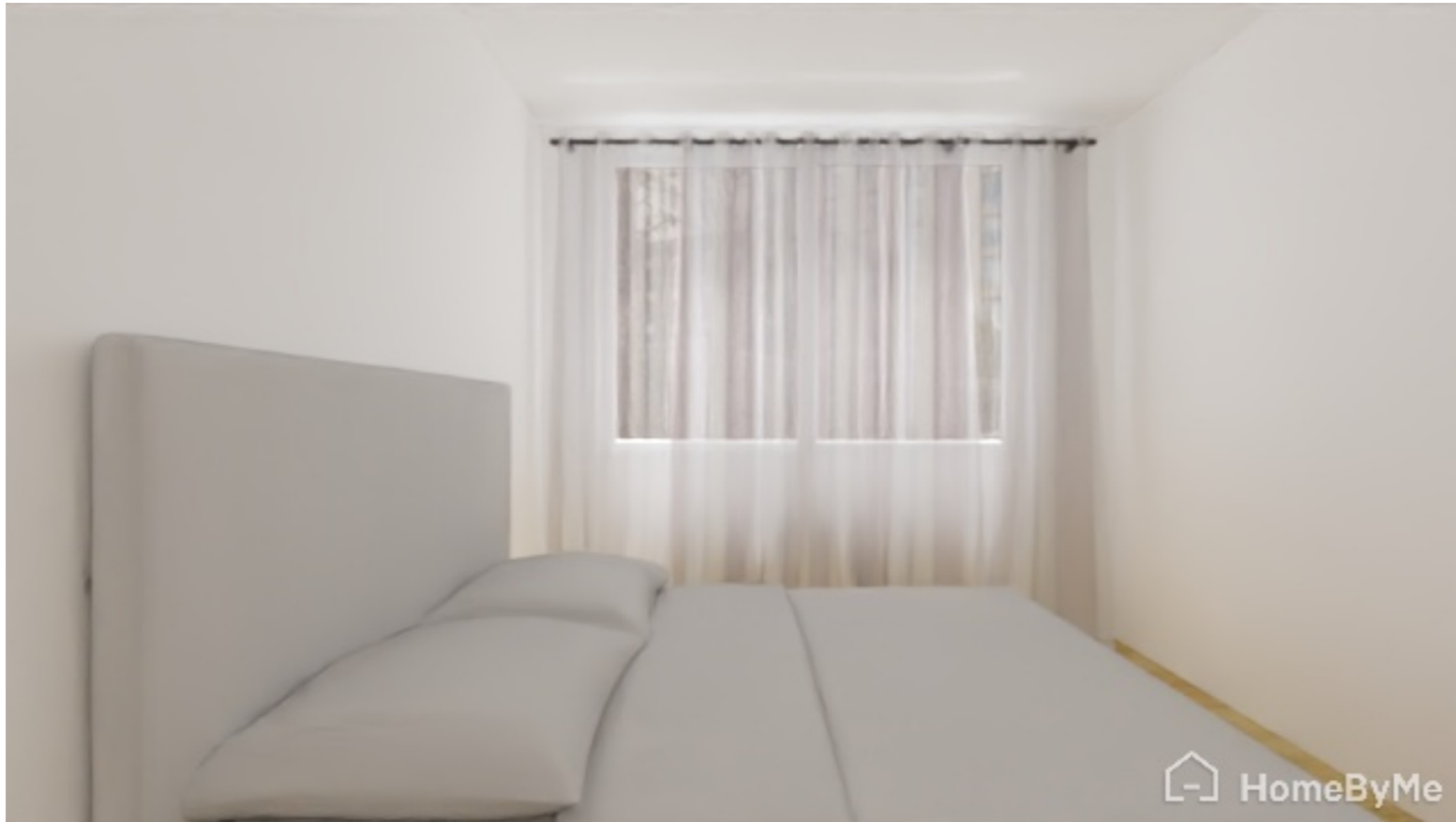
Une pièce épurée propice à la projection

Objectif : ranger et rendre la chambre le plus neutre et claire possible afin que les futurs acheteurs se projettent avec leur propre décoration